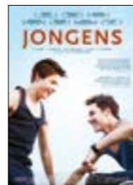
JONGENS von Mischa Kamp NL 2014, 78 Minuten, niederländische OF mit deutschen UT, Edition Salzgeber, ▶ www.salzgeber.de

„Ich bin nicht schwul.“ – „Natürlich nicht.“ Ob Sieger und Marc es jemals werden, ob sie sich diesen Begriff jemals zuschreiben wollen und werden, wissen wir nicht. Wir können in diesem zauberhaften Film aber sehen, was für eine sanfte und umfassende Kraft zwei Küsse zwischen Jungs haben können und was für ein anspruchsvolles Programm der Arbeit an sich selbst sie freisetzen können. Coming-Out ist der Name dieser Arbeit. ■